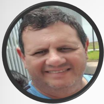
Presidente Núcleo Barracão Presidente Fronteiras