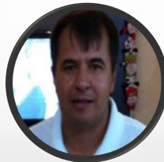
Presidente Núcleo SAS Empresário