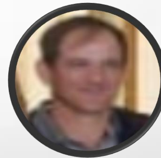
Vice-Presidente SAS Empresário