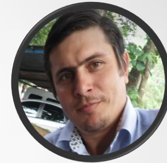
Vice-Presidente Capanema Empresário